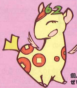
個人住民税PRキャラクター ぜいきりん